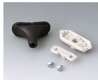
B2911329 Cable gland kit, 5.0 - 5.9 TPE black RAL 9005