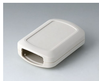
B2832107 CONNECT M ASA+PC (UL 94 V-0) off-white RAL 9002 76x54x22mm