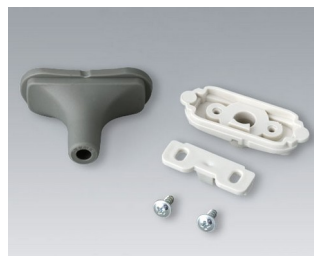
B2911328 Cable gland kit, 5.0 - 5.9 TPE volcano