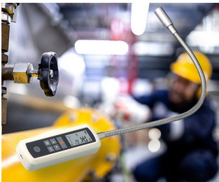
Gas leak detector