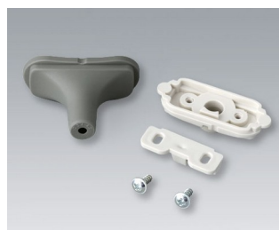
B2911308 Cable gland kit, 3.4 - 4.2 TPE volcano