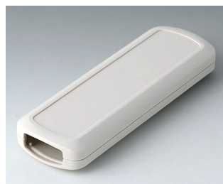
B2834107 CONNECT M ASA+PC (UL 94 V-0) off-white RAL 9002 156x54x22mm