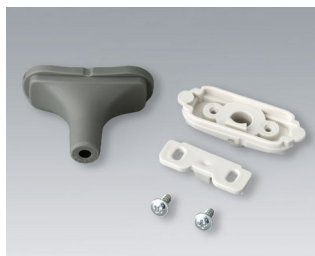
B2911318 Cable gland kit, 4.2 - 5.0 TPE volcano