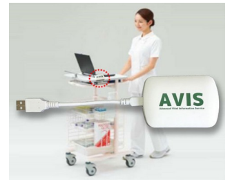
Receiver and data transfer for EMR