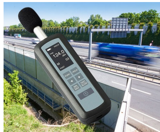
Noise level measurement