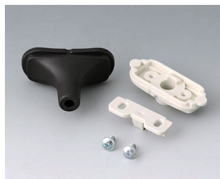
B2911319 Cable gland kit, 4.2 - 5.0 TPE black RAL 9005