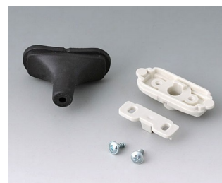
B2911309 Cable gland kit, 3.4 - 4.2 TPE black RAL 9005