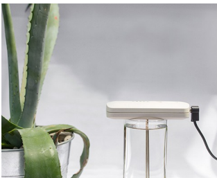
Tool for making colloidal silver solutions