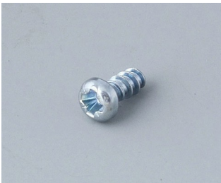
A0304031 Self-tapping screws 2.2 x 5 mm (PZ1)