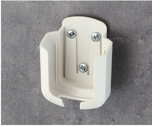
B2931507 Holder M ASA+PC (UL 94 V-0) off-white RAL 9002