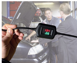
Voltage and current display during trickle charging