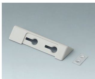
B4705207 Desktop stand set ASA+PC (UL 94 V-0)