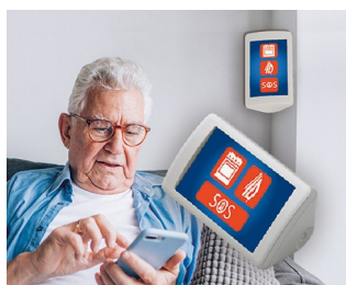
AAL assistance system