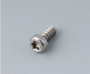
A0325060 Self-tapping screw 2.5 x 6 mm (T8) Stainless steel