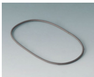
B4708920 Seal S