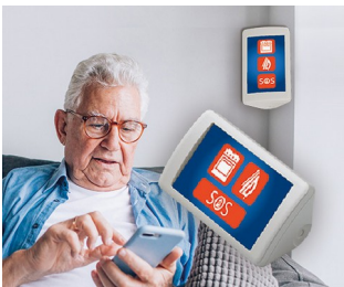
AAL assistance system