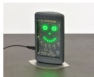
Room air measuring device