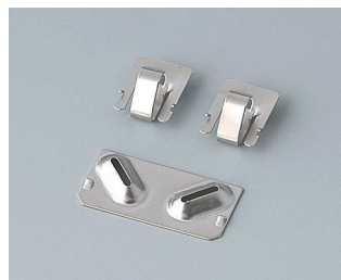
A9190003 Set of battery clips, 2xN/2xAA/2xAAA Steel nickel-plated