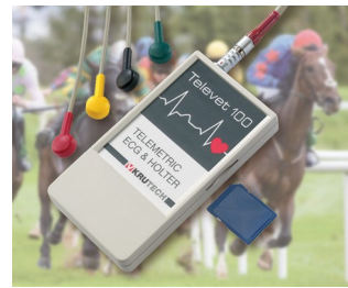
Telemetric ECG system for veterinary medicine