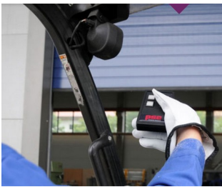
IR remote control for harsh environments