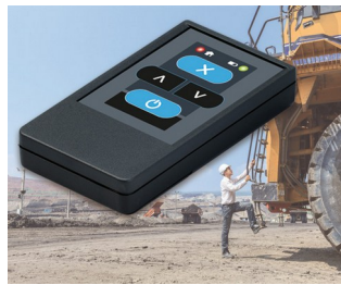
Radio transmitter for machines