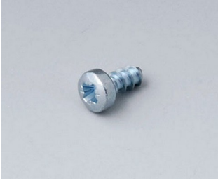
A0306031 Self-tapping screws 3 x 6 mm (PZ1)