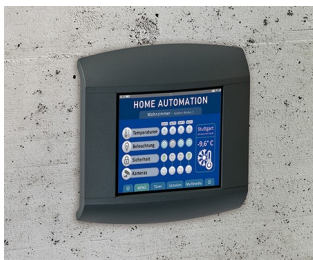
Control panel for home automation