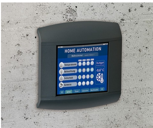
Control panel for home automation