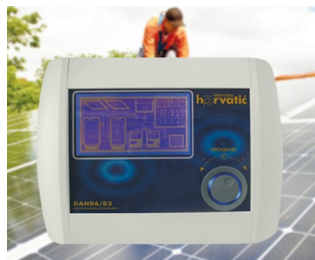
Control unit for photovoltaic solar installations