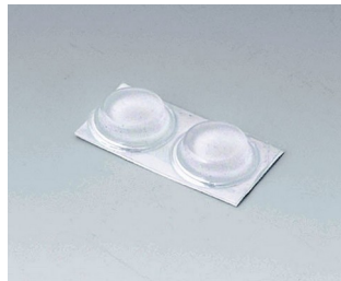
A9212330 Anti-slide feet 12 x 3.5 mm transparent