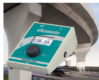
Ultrasonic measuring device