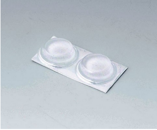
A9212330 Anti-slide feet 12 x 3.5 mm transparent