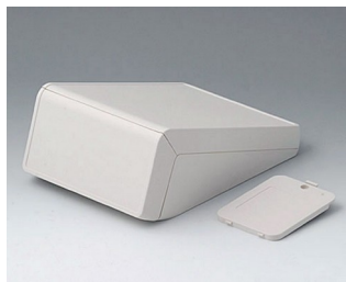
B4056207 UNITEC M, 0.6/0.6 ABS (UL 94 HB) off-white RAL 9002 148x210x80mm IP 40