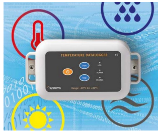
Data logger e.g. for temperature