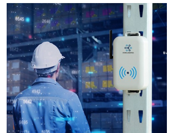
Smart store logistics