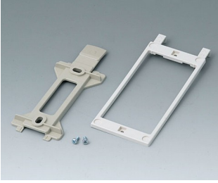
B1360048 Wall suspension elements ABS (UL 94 HB) pebble grey RAL 7032