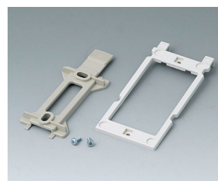
B1350048 Wall suspension elements ABS (UL 94 HB) pebble grey RAL 7032