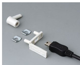
A9320207 USB cover, type Mini-USB PP off-white RAL 9002 29.5x8.5mm