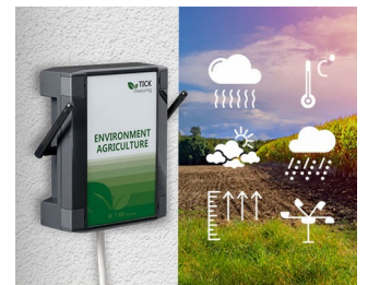
Weather station in agriculture