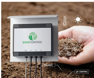
Smart Farming - system for long-term measurements