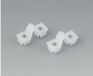
C2299031 Securing hinge for the cover PP natural-coloured