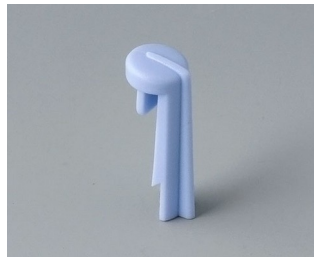
A1105006 Arrow PA 6 (UL 94 HB) sky