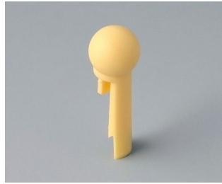
A1102004 Globe PA 6 (UL 94 HB) beach