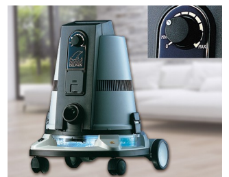
Operating element for a vacuum cleaner