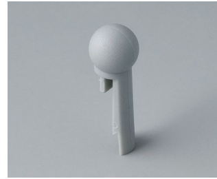
A1102007 Globe PA 6 (UL 94 HB) mineral