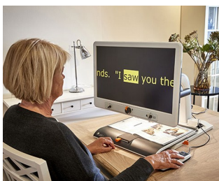
Control knobs for video magnifier