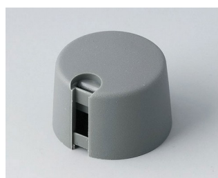
A1024638 TOP-KNOBS 24 PA 6 volcano 24x16mm 1/4"