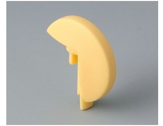
A1103004 Disk PA 6 (UL 94 HB) beach