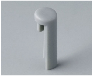
A1101007 Pin PA 6 (UL 94 HB) mineral