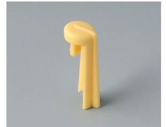
A1105004 Arrow PA 6 (UL 94 HB) beach